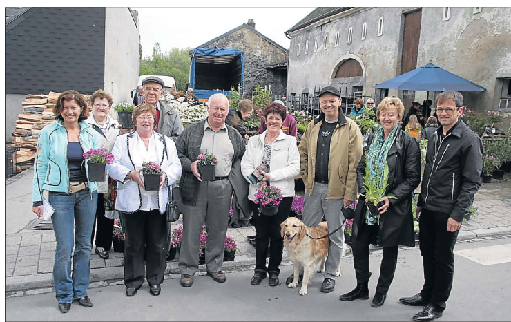
Am Sonntag stand Olingen im Zeichen der Blumen und Pflanzen.