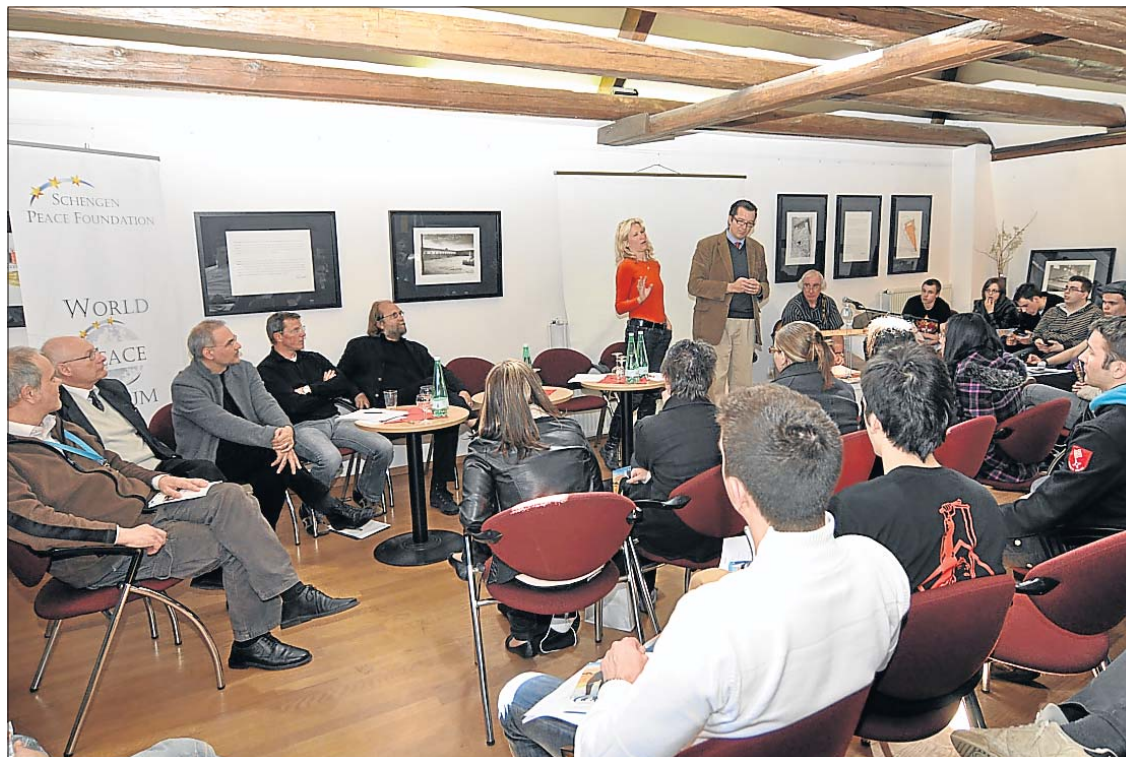
Die Initiatoren des „World Peace Forums“ haben unter der Federführung der „Schengen Peace Foundation“ mit über 60 Universitäten, Schulen und Stiftungen ein vierwöchiges Veranstaltungsprogramm zusammengestellt.

Verschiedene runde Jubiläen werden in diesem Jahr weltweit gefeiert